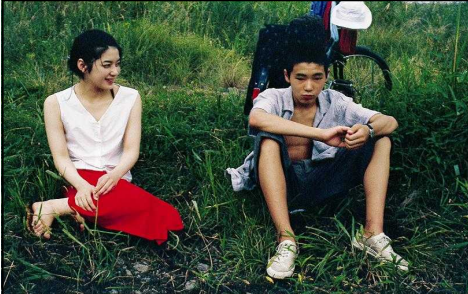
「美しい夏キリシマ」 06 配給：パンドラ