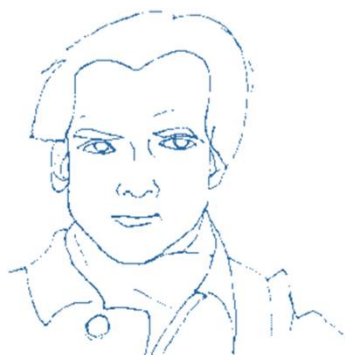
さえき ゆうぞう 佐伯祐三