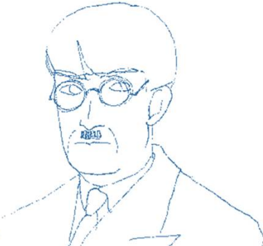
ふじた つくはる 藤田嗣治

鳥取の郷土作家の前田寛治ほか、4人の洋画家たちが、留学先のパリを舞台にして作品を生み出していく協力型ゲーム！