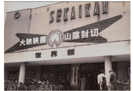
鳥取市歴史博物館 蔵