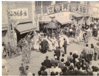
鳥取市歴史博物館 蔵