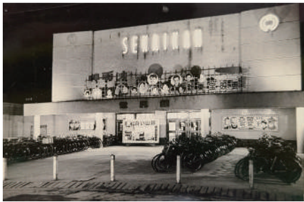
鳥取市歴史博物館 蔵