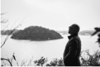
鳥取市湖山池畔にて