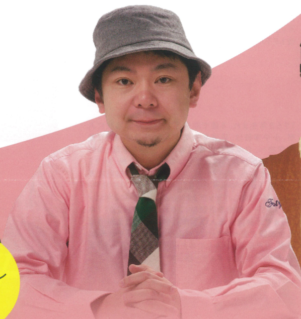
鈴木おさむ氏 (放送作家)